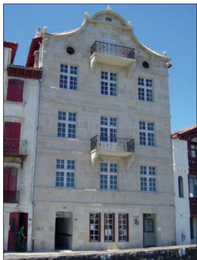
En photo : maison natale de Maurice Ravel

À partir de 1901, il fait de longs et fréquents séjours sur la côte basque. Ce « pays de soleil, de corridas, de fandangos, de pelotaris » l'enchanté. Il parle un peu l' euskara dont il sème quelques mots dans ses lettres aux amis de là-bas, il aime se baigner sur la plage de Saint-Jean-de-Luz et faire l'ascension de la Rhune. En 1914, il y compose son Trio pour piano et cordes dont le premier thème, de « couleur basque », s'inspire du rythme du zortzico (forme poétique traditionnelle illustrée par les bertsolari et danse caractéristique mesurée à cinq temps).